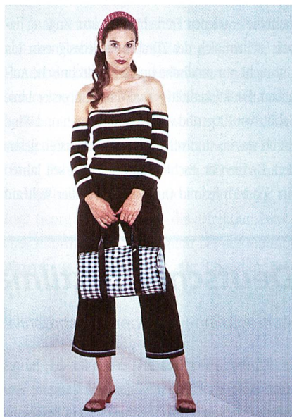
Ingeborg Bachmann: Sinnesreise, Fernweh und Neugierde – der Sonne entgegen , PASSPORT zeigt für den Sommer 2001 Inspiration von Mustern und neuen Garnen für die Modern Woman. Function, form & fantasy – mit diesen Komponenten lässt PASSPORT eine Mode entstehen, die Lebensfreude ausdrückt.

Einzelheiten sind erhältlich von www.lyson.com .