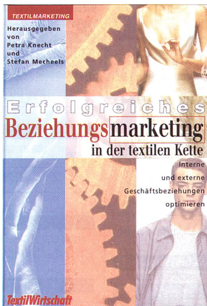
Cover «Erfolgreiches Beziehungsmarketing in der textilen Kette»

Jahrhundert. Beziehungsnetzwerke zu entwickeln und diese als Teil der Unternehmenskultur zu verstehen, erhält damit höchste Priorität.