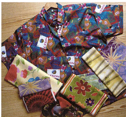
Produkte, bedruckt mit Digital-Inkjet-Textilfarben von Lyson

und Waschbarkeit? einzubüssen. Die digitalen Textilfarben von Lyson werden über ein internationales Vertriebsnetz angeboten.