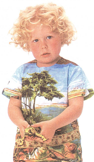
Oily Jeans