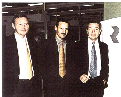
Übergabe der 500. Ringspinnmaschine G33 an Selvafil (E)

Die Ringspinnmaschine G 33 der Fa. Rieter hat sich sehr gut im Markt etabliert und das nicht ohne Grund. Merkmale der G 33, wie z.B. die bewährte Technologie, das komfortable Antriebskonzept, das unterwindfreie Doffen, das