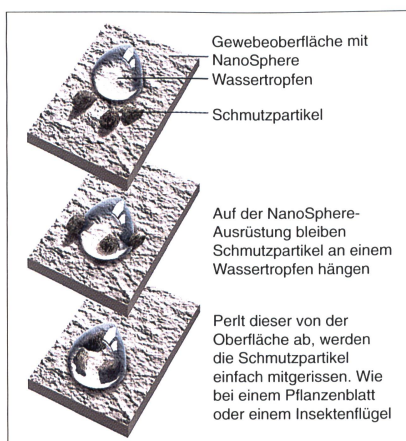
Abb. 1: Die Funktion des Nano-Finish

Parallel zu dieser Strukturbildung entsteht durch gelbildende Zusätze das Porensystem einer Membrane. Auf dieser dreidimensionalen Oberflächenstruktur kann sich Schmutz nicht festsetzen und Wasser wird abgewiesen. Das in der Schweiz entwickelte Verfahren entspricht