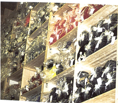
Neues Stofflager aus Holz

Es genügt heute nicht mehr, nur eine hervorragende Qualität zu produzieren. Der Kunde und der Verbraucher verlangen dazu noch eine Zertifizierung. So ist vorgesehen, dass in diesem Sommer das Total-Quality-Management 9000/2000 realisiert wird. Damit wird das bisher höchste zu erreichende Qualitätsziel zu einem zusätzlichen Verkaufs-Argument. RW