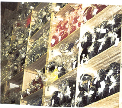
Neues Stofflager aus Holz

Es genügt heute nicht mehr, nur eine hervorragende Qualität zu produzieren. Der Kunde und der Verbraucher verlangen dazu noch eine Zertifizierung. So ist vorgesehen, dass in diesem Sommer das Total-Quality-Management 9000/2000 realisiert wird. Damit wird das bisher höchste zu erreichende Qualitätsziel zu einem zusätzlichen Verkaufs-Argument. RW