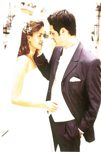
Modischer Einreiber aus der Frühjahr/Sommerkollektion 2001 der Marke Wilvorst

Bugatti ist neben Pikeur die stärkste Marke der Gruppe Brinkmann, und ist auch in der Schweiz mit einer Vertretung in Zürich ein star-