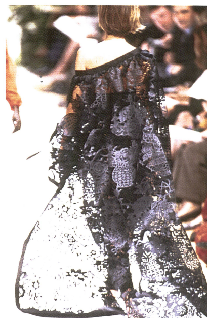
Spektakulärer Tüllmantel von Jakob Schlaepfer, verarbeitet von Balmain

Textilschaffen natürlich sehr entgegen und es erstaunt deshalb nicht, dass manche der exquisitesten Kreationen auf den Pariser Laufstegen ihren textilen Ursprung in der Schweiz hatten!