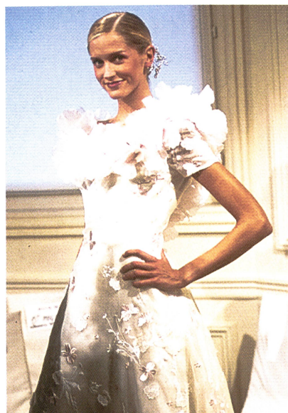
Zauberhafte Mariée von Forster Willy, verarbeitet von Hannae Mori

Dieses Manifest der Dekoration und der Freude am Schönen kommt schweizerischem