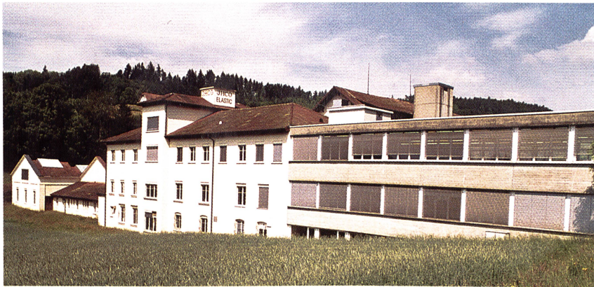
Das Produktions- und Verwaltungsgebäude der JHCO Elastic AG