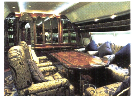
Customised Aircraft Interior