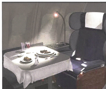
Konzept Swissair First Class

Die direkten Produktkosten müssen in einer vorbestimmten Bandbreite liegen, wie auch die indirekten Kosten, soweit sie von unserer Seite beeinflussbar sind. Als Beispiel sei hier nur das Warengewicht von Stoff und Teppich genannt, mit dem wir die Brennstoffkosten niedriger halten können. Beim Einsatz in einem wide body Flugzeug kann dies leicht einige 100 kg ausmachen. Der Schlüssel zum Erfolg liegt auch hier darin, die richtige Balance zu finden und diese mit dem Kunden abzusprechen.