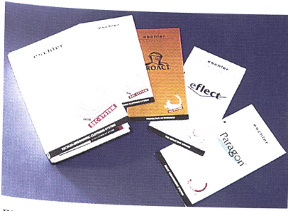
EEC-Systemordner der Cbr. Eschler AG