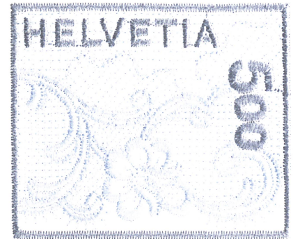
Abb. 1: Angeordnet in Einzelmarken oder in Viererblöcken wurde die textile Briefmarke bei Geissbühler ausgerüstet

In der Vorbehandlung bearbeitet das Unternehmen Gewebe für Druckereien, welche teilweise auch wieder im Hause Geissbühler ausgerüstet werden. Polyesterweben und deren Mischungen werden ausgewaschen, auf einen bestimmten Restschumpf hin thermofixiert und unter anderem für die Gewebe-Beschichtung vorbehandelt. Alle Fasertypen und Mischungen können gebleicht werden. Beim Stückfärben werden die folgenden maschinellen Verfahren