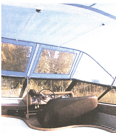
Abb. 3: «Planofil» aus dem Hause Geissbühler ist mit einer ökologischen PU-Beschichtung ausgerüstet. Es eignet sich besonders für Schiffabdeckungen.

Aber auch die gesamte Nassvorbehandlung der gestickten Briefmarke wurde im Hause Geissbühler durchgeführt. Nach dem Waschen und Thermofixieren erfolgte eine Hydrophobbeschichtung, bevor auf das Gewebe die beidseitig mit Kleber beschichtete Folie aufgebracht wurde. Zum Schluss erhielt die Marke noch ein Deckblatt. Und die Sammler eine Briefmarke, die sie mühelos abziehen können, ohne sie wässern zu müssen.