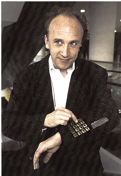
Fandy-Fashion and Handy-Jacke, Klaus Steilmann Institut für Innovation und Umwelt

Die avantex zeigte auch, dass der Mikrosystemtechnik bei der Entwicklung von Hochtechnologie-Bekleidung künftig eine Schlüsselrolle zukommt. Das gilt sowohl für Lifestyle- und Aktivsportkleidung, als auch für Berufs- und Schutzkleidung. Ein weiteres Feld ist Kleidung mit medizinischen Funktionen – zum Beispiel mit integrierten Sensoren zur Kontrolle der Körperfunktionen, wie des Pulses oder der Herzfrequenz. Aber auch bedarfsgerechte Klimatisierung, Orientierungs-, Ortungs-, Zugangs-, Handhabungs- und Warnsysteme für unterschiedlichste Zwecke bekommen immer mehr Bedeutung. Das steht nach der avantex fest. Es wurden aber auch neue Herstellungsverfahren vorgestellt, darunter Ganzkörperscanner und Zuschneidmaschinen.