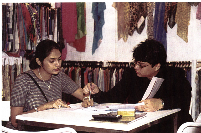
Interstoff Asia Autumn 2000

Internationale Institute und Unternehmen präsentierten revolutionäre Innovationen in der Bekleidungsbranche. Darunter Jacken, mit denen der Träger telefonieren oder im Internet surfen kann, Anzüge, die Neurodermitis-Geplagen helfen, den Juckreiz zu überwinden, geruchsabweisende Socken oder Sportbekleidung, und viele andere Kleidungsstücke, die in Zukunft im Handel auf der Stange hängen sollten.