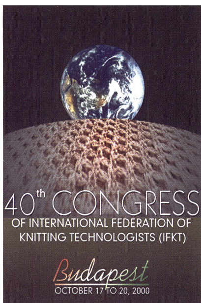
40. Weltkongress IFWS: Internationale Föderation von Wirkerei- und Strickerei-Fachleuten vom 17. bis 20. Oktober in Budapest (H)