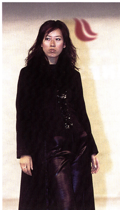
Fabrics-China-Fashion-Show auf der Intertextile 2000

Zwar wurden weniger Besucher als vor zwei Jahren registriert, doch die Qualität der Fach-