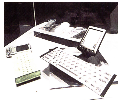
Soft- & Qwerty-Tastatur aus Stoffen, Elektex, GB, avantex

Als die Intertextile Ende Oktober in Schanghai ihre Pforten schloss, hatte sie die erfolgreichste Auflage in ihrer sechsjährigen Geschichte absolviert. Eine von lebhaften Geschäften geprägte Atmosphäre und ein mit Sonderveranstaltungen und Ausstellungen angefülltes Programm