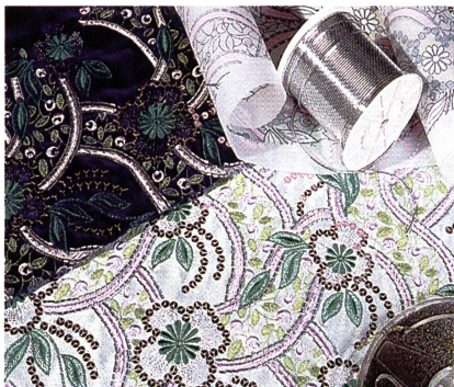
Abb. 2: Mustermöglichkeiten auf der neuen Stickmaschine

mit einer Breite von 1,5 m, getestet werden. Kleinstaufträge lassen sich auf der Era mit 60 Nadeln produzieren. Der Maschinenmix aus Hochleistungsmaschinen und flexiblen Kleinmaschinen, ermöglicht eine hohe Flexibilität und eine auf den jeweiligen Auftrag angepasste Produktionssteuerung. «Wir haben für jeden Auftrag die richtige Maschine», meint Geschäftsführer Thomas Leemann.