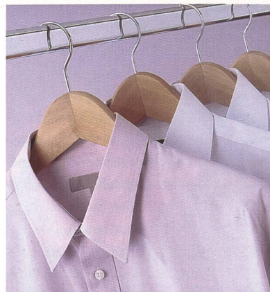
Frische aus dem Kleiderschrank

Unabhängige antimikrobielle Untersuchungen von Baumwollbekleidung zeigen, dass durch Purista™ das Wachstum der Bakterien, die für Geruchsentwicklung und das nachlassende angenehme Tragegefühl verantwortlich sind, erheblich reduziert wird. Avecia hat das Purista™ Co-Branding eingeführt, um die Vorteile dieser Ausrüstung eindeutig und positiv den Verbrauchern vermitteln zu können.