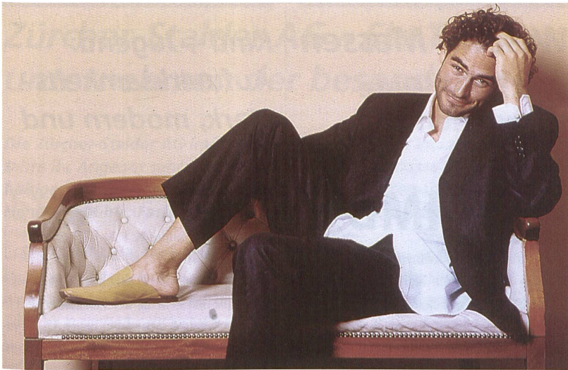
Bugatti: 100 % Leinen

fung. Aber auch für den nächsten Sommer werden sie wieder ins Rennen geschickt, die kniebedeckenden Bermudas, oft sogar mit asymmetrischem Saum. Daneben werden vor allem im Freizeitbereich die lässig-locker fallenden Varianten mit Bändchenzugbund versehen, wie bei