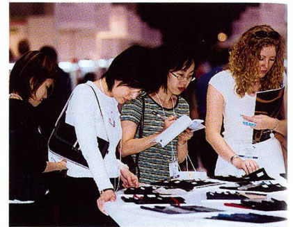
Interstoff Asia: Trends – immer gefragt bei den Besucherinnen

Der Rekord der Aussteller- und Besucherzahlen auf der Intertextile Shanghai 2002 vom 9. bis 11. Oktober im Shanghai New International Expo Centre, spiegelt das kontinuierliche Wachstum der chinesischen Wirtschaft wider.