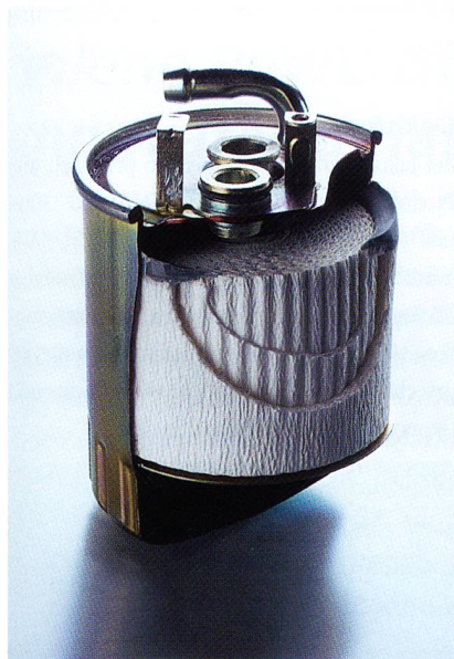
Abb. 2: Celanex PBT 2008 als Meltblown-Vliesstoff für die Kraftstofffiltration

Bereich ausgelegt ist. Dieser Medizin-Typ, Fortron PPS 9203HS, erfüllt alle wichtigen Zulassungskriterien für medizinische Anwendungen und den Lebensmittelkontakt (u. a. FDA Drug and Device Master Files, USP Class VI).