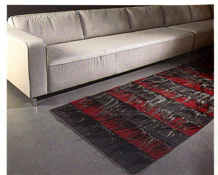
Caura cotschna aus der Kollektion «+plus»

Nach mehrjähriger Entwicklungszeit kann Ruckstuhl jetzt die neue Qualität RollerTile sowohl als Applikation für den Doppelboden wie auch als selbstliegende Fliese anbieten. RollerTile gehört zu den schwersten am Markt erhältlichen Qualitäten. Basierend auf der schon im Ruckstuhl-Sortiment vorhandenen Qualität Rollerwool wurde das Einsatzgewicht der Wollmischung auf 1'600 g/m 2 erhöht und zusätzlich die Dichte verstärkt. Die Zusammensetzung des Polmaterials wurde in der bewährten Mischung aus 80 % reiner Schurwolle aus ver-