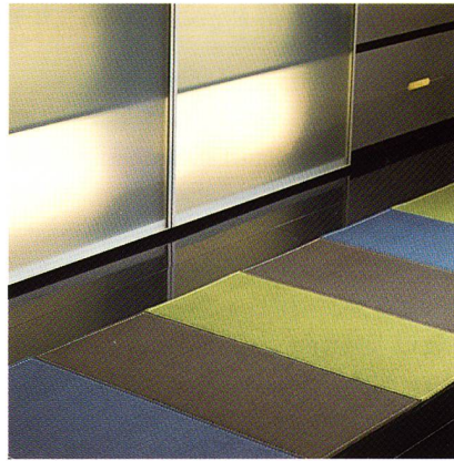
Die neue Filzqualität Fetro color

Bei «Rep» handelt es sich um einen stuhllongeeigneten Rips aus 60 % Wolle, 20 % Haargarn und 20 % Polyamid, mit dem man bei Ruckstuhl an die Verkaufserfolge schon vorhandener Haargarn-Qualitäten im Sortiment