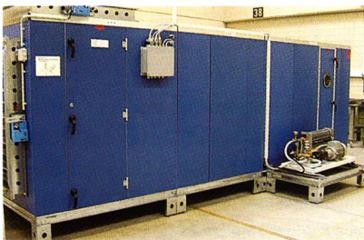
Luwa Unitary System