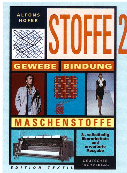
Stoffe 2 von Alfons Hofer

dungslehre ist umfassend dargestellt und leicht verständlich aufgebaut. Sogar Mehrlagengewebe werden behandelt. Auch die Herstellung der verschiedenen Arten von Maschenwaren wird für den Leser verständlich abgehandelt. Vielleicht wäre hier ein kurzes Kapitel über auf Flach- und Rundstrickmaschinen herstellbare Fertigbekleidung angebracht. Die komplizierte Bindungstechnik der Kettenwirkerei wird ebenfalls gut präsentiert.