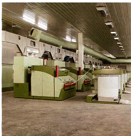
Abb. 15: die Karde C 60 im praktischen Einsatz

Ringgarnprozess. Die Aufgabe der Maschinenhersteller liegt darin, diesen Kundenanforderungen entsprechende Lösungen anzubieten. Mit der Karde C 60 entspricht Rieter diesen Forderungen, indem, neben der klassischen, Bandablagen mit vollwertigen Streckpassagen zur Verfügung stehen, um eine Prozessverkürzung zu ermöglichen.