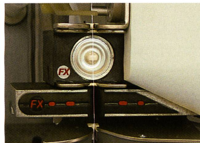
Abb. 2: Ecopack FX Längenmessung

Flexibel anpassbar, wartungsarm, bedienerfreundlich – das sind die Leistungsmerkmale