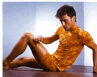
Herrenunterwäsche von Mey aus Trevira Micro

ne unelegant zu wirken. Vor allem bei Baumwoll- und Leinenqualitäten nutzt man diesen Kontrast, um eine interessante Spannung in der Kombination zu erzeugen. Diskrete Oberflächenstrukturen, Webreliefs, Crash- und Knitterlook machen einen «ungebügelt» Eindruck und unterstützen den Trend hin zu einer natürlichen Eleganz. Matte Oberflächen stehen glatten, polierten gegenüber. Sie erinnern an polierte Mineralien. Innovative Ausrüstungen, Beschichtungen, Pigmentierungen und Waschungen sind unentbehrlich. Denim und De-