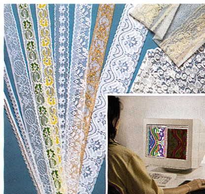
Vielfältige Mustermöglichkeiten mit Hilfe der Häkelgalontechnologie

ble Bandbreiten werden über Kurvenscheiben angetrieben. Der Gummistangenantrieb ist auf einer separaten Welle montiert, was eine gute Zugänglichkeit ermöglicht und die Einstellung des Hubs und des Timings erleichtert. Die Maschine steht in Breiten von 420 und 630 mm sowie mit 4, 5,5, 6, 7 und 8 Nadeln pro cm zur Verfügung. Typische Einsatzgebiete sind elastische und nicht-elastische Bänder. Für die Herstellung maschenfester elastischer und nicht-elastischer Artikel ist der Maschinentyp Raschelina® RD3 2KLS konzipiert. Dabei arbeiten zwei unabhängig voneinander ansteuerbare Kettlegeschieben im jeweiligen Band verschiedene Bindungen. Die Maschine Raschelina® RD3MT3 entspricht der Grundmaschine RASCHELINA® RD3. Die Musterung wird jedoch vom elektronischen Summiergetriebe MÜRATRON gesteuert, d.h. nicht über eine Dessinkette, was praktisch unbegrenzte Rapportlängen erlaubt. Schon bei 256 kB Speicherplatz ist ein Rapport von 60'000 Maschen möglich, wobei bis 250 Muster gespeichert werden können. Die Maschine besticht auch durch ihre äusserst einfache Programmierbarkeit. Die Musterkreation erfolgt über MÜDATA®4 direkt an der Maschine oder mit der MÜCARD-Software auf einem se-