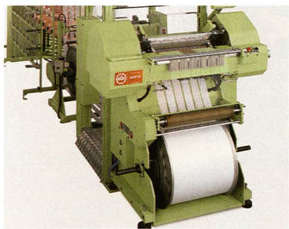
MDR42 – durch die Möglichkeit, maximal 24 Schussstangen bei unbegrenzter Rapportlänge einzusetzen, eröffnen sich ganz neue Mustermöglichkeiten