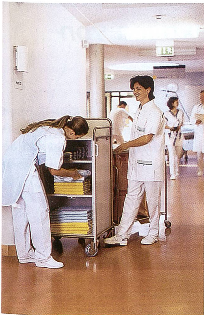
Abb. 1: funktionelle Proact® Maschenstoffe

ten aus Trevira Bioactive an. Diese antimikrobiellen Workwear-Materialien sind für den medizinischen Bereich konzipiert, denn vor allem im Gesundheitswesen besteht die Forderung nach infektionspräventiven Textilien für Schutz-, Pflegepersonal- und Patientenbekleidung (Abb. 1). Hohen Tragkomfort verspricht die Atmos® Piqué-Qualität aus antimikrobiellen Trevira Garnen. Neben der Anwendung im Krankenhaus- und Pflegebereich können antimikrobielle Textilien bei der Lebensmittelher-