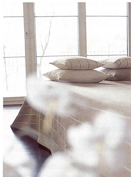
Natura-Kollektion – pflegefreundlich und lichtecht

Vorbei die Zeiten, als man mit Lamellenvorhängen unangenehme Zahnarztbesuche und langweilige Amtsstuben verband. Heute ist der einst verstaubt wirkende Fenster-, Sicht- und Blendschutz wieder salonfähig. Mit der Kollektion «systems» tritt das Langenthaler Textilunternehmen création baumann den Beweis an: Die Lamellenvorhänge bieten variantenreiche, zeitlose Lösungen rund ums Fenster – zu Hause und im Büro.