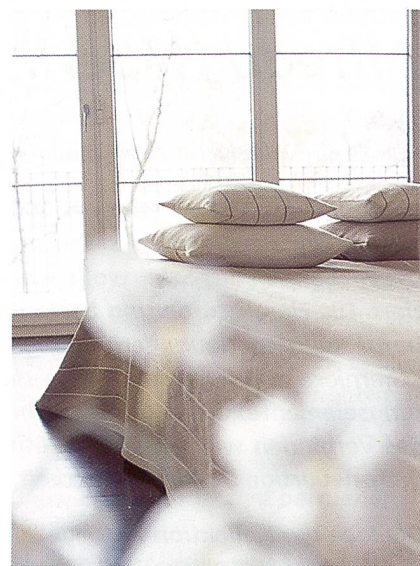
Natura-Kollektion – pflegefreundlich und lichtecht

Vorbei die Zeiten, als man mit Lamellenvorhängen unangenehme Zahnarztbesuche und langweilige Amtsstuben verband. Heute ist der einst verstaubt wirkende Fenster-, Sicht- und Blendschutz wieder salonfähig. Mit der Kollektion «systems» tritt das Langenthaler Textilunternehmen création baumann den Beweis an: Die Lamellenvorhänge bieten variantenreiche, zeitlose Lösungen rund ums Fenster – zu Hause und im Büro.