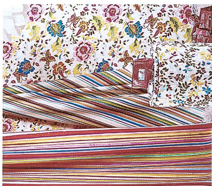
smart und trendy – das Horn-Coordinate «Disco»