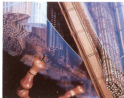
Die neue Rollo-Kollektion; eine Vielzahl attraktiver Bambus- und Holzgewebe

Eine technische Finesse im Massprogramm Plexipaneele ist das neue Schienensystem, das individuelle Einsatzmöglichkeiten erschliesst. So ist z.B. eine Montage von Wand zu Wand problemlos möglich. Die Plexipaneele sind in jeder individuellen Farbe lieferbar und als Flächenvorhang oder auch als Raumteiler im privaten, wie auch im Objektbereich einsetzbar.