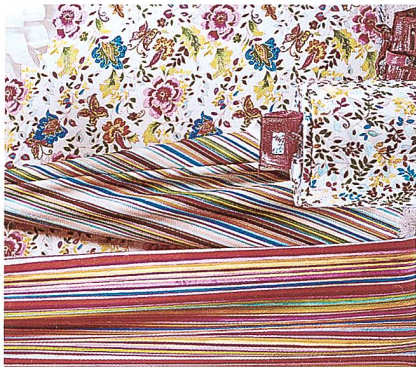
smart und trendy – das Horn-Coordinate «Disco»