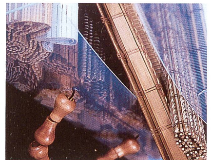
Die neue Rollo-Kollektion; eine Vielzahl attraktiver Bambus- und Holzgewebe

Eine technische Finesse im Massprogramm Plexipaneele ist das neue Schienensystem, das individuelle Einsatzmöglichkeiten erschliesst. So ist z.B. eine Montage von Wand zu Wand problemlos möglich. Die Plexipaneele sind in jeder individuellen Farbe lieferbar und als Flächenvorhang oder auch als Raumteiler im privaten, wie auch im Objektbereich einsetzbar.