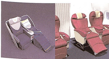
Produkte der Lantal Textiles

Man schrieb das Jahr 1954, als der holländische Agent der Möbelstoffweberei Langenthal bei der Fluggesellschaft KLM vorsprach, um Sitzbezugsstoffe für Büromöbel zu verkaufen. Diesen Auftrag brachte er zwar nicht mit nach Langenthal zurück, dafür aber die erste Order für Flugzeugsitz-Bezüge. Der alles verändernde Einstieg in den Bereich der Verkehrs-Textilien war getan. Eine Pionierleistung, nicht nur in der Retrospektive. Denn das Schweizer Unternehmen war eines der ersten in der textilen Ausstattung von Passagierflugzeugen.