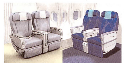
Produkte der Lantal Textiles (Quelle Internet)

Die Fotografien wurden nach dem Aspekt «Wandel – im Denken, in der Technik, in der Kultur» zusammengestellt. Sie zeigen unter anderem ein eigens für den Präsidenten von Nigeria ausgestattetes Flugzeug sowie das topmoderne Design des Airbus A380 Mock-up aus dem Jahr 2004. Der prägnante Text belegt die symbiotische, wechselhafte und aufregende Verbindung zwischen den Geschichten der Lan-