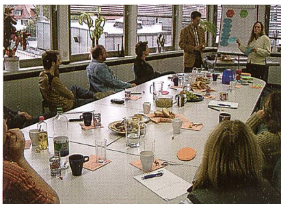
Seminar bei NTS

tum und ein sicheres Fundament des Unternehmens.