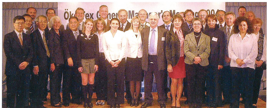
Gruppenfoto Institutsleitersitzung in Kyoto

Die Aufteilung der Zertifikate nach Öko-Tex Produktklassen verdeutlicht das hohe Verantwortungsbewusstsein der japanischen Textil- und Bekleidungsbranche: 51 % der ausgestellten Zertifikate – deutlich mehr als der übliche Durchschnitt – entfallen auf die Produktklasse I für Babyartikel, erfüllen also die strengsten Anforderungen des Öko-Tex Prüfsystems. Nach den Vorgaben der Produktklasse II für hautna-