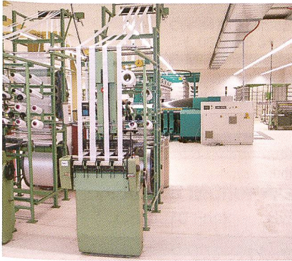
Webmaschinen mit Blick Richtung Zettlerei

eingeleitet. Junge, gut ausgebildete und motivierte Nachwuchsleute bilden heute die erweiterte Geschäftsleitung. Wichtigstes Kapital sind die ca. 120 Mitarbeiterinnen und Mitarbeiter die hier in Küttigen dafür sorgen, dass KUNY-Firmen auch weiterhin weltweit überdurchschnittliche Leistungen anbieten können.