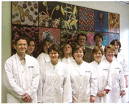
Team des Instituts für Hygiene und Biotechnologie

und Dienstleistungsangeboten, z. B. im Bereich der Bekleidungsphysiologie. So kann in den Hohensteiner Laboren der individuelle Trage- bzw. Schlafkomfort für eine Daunenjacke, eine Daunendecke oder einen Schlafsack ermittelt und auf Wunsch auch mit dem Hohensteiner Qualitätslabel ausgewiesen werden. In Kombination mit den Angaben zum Füllmaterial lassen sich so umfassende Qualitätsaussagen für ein Produkt treffen, die insbesondere auch dem Fachhandel bei der qualifizierten Beratung helfen.