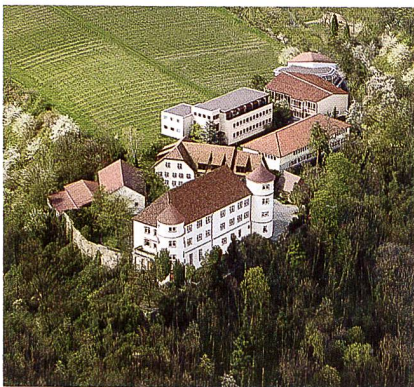
Die Hohensteiner Institute aus der Vogelperspektive