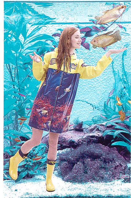
Drei-Lagenlaminat für Regenbekleidung

goldgelber Fische in blutroter Korallenlandschaft sorgt diese Wetterschutz-Ware für Farbe im Regengrau und gute Laune beim Betrachter. Unterstützt wird dies vom Sonnengelb des Materials an den Ärmeln und auf der Mantelrückseite. Das hierfür verwendete Laminat wurde speziell für den Einsatz in Sportbekleidung hergestellt und kombiniert drei funktionelle Schichten: eine Kettenwirkware mit einer gezielt atmungswirksamen Musterung auf der Aussen-seite, eine atmungsaktive, wasserabweisende Membran darunter und eine leichte Meshware zu deren Schutz auf der Innenseite. Die Wirkwaren wurden jeweils auf einer HKS 3-M hergestellt – mit einer EBA 2-Step Modifikation für die Deckware. Die Verbindung des Textilmaterials mit der mikroporösen Membran erfolgte durch das Point-in-Point-Verfahren der Firma