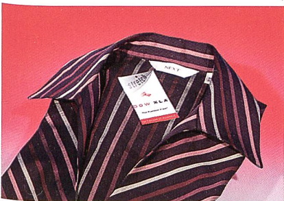
Hoher Tragekomfort bei NEXT

DOW XLA ist die erste Elastikfaser auf Olefinbasis, die auf dem weltweiten Textilmarkt angeboten wird. Sie verfügt über fortschrittliche Moleküleigenschaften und weist eine hohe Hitze- und Chemikalienbeständigkeit auf – sogar bei Temperaturen bis 220 °C. Diese aussergewöhnlichen Möglichkeiten bieten Garn- und Textilienherstellern zahlreiche Vorteile, denn dank ihnen ist die DOW XLA Faser zur effizienten Kegelfärbung geeignet, kann extremen Färbungs-, Bleichungs-, Mercerisierungs- und Kleidungs Waschbedingungen ausgesetzt werden und eignet sich für das Thermosol-Färbeverfahren unter Standardbedingungen.