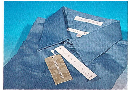
Einstellbarer Stretch bei Perry Ellis

Wie viele andere Industriebereiche, steht auch die Textilbranche vor der Herausforderung, gleichzeitig die Kosten zu dämpfen und trotzdem die Entwicklung modernster Produkte vorwärts zu treiben. Der Bekleidungsmarkt ist durch hohe Diversifizierung und eine Vielzahl von Wettbewerbern gekennzeichnet. Hersteller, Designer und Händler sind stets auf der Suche nach Textilprodukten, die Bearbeitungsvorteile bieten und ihnen beim Verkauf entscheidende Vorteile gegenüber der Konkurrenz bringen können.