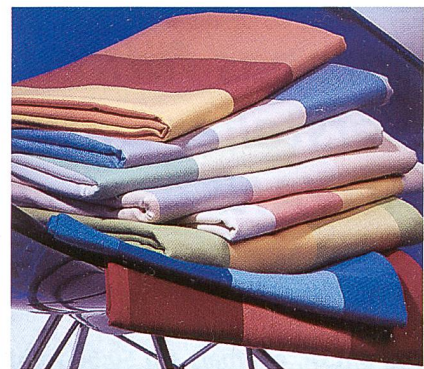
Abb. 3: Zusatzfunktion durch antibakterielle Eigenschaft

In der Regel werden an Medizin- und Hygienetextilien sehr hohe und vielfältige Anforderungen bezüglich Funktion, Körperverträglichkeit und Komfort gestellt, die über den gesamten Lebenszyklus des Textils garantiert werden müssen. Spezielle Trevira Polyesterfasern und -filamentgarne leisten auch hier einen wichtigen Beitrag. Ein spezielles Gebiet der Medizintexti-