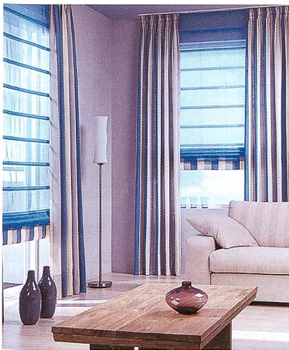
Abb. 2: Objekttextilien aus Trevira CS, Foto: Ado

heimen und im Krankenhaus zusammen. Das Angebot an antimikrobiellen Textilien aus Trevira Bioactive wird jetzt ergänzt durch Bade- und Saunamäntel (Abb. 1). Der Frottierwarenhersteller Dyckhoff GmbH in Rheine erweitert damit seine Palette an hygienischen Textilien für den Objektbereich um eine weitere, wichtige Komponente.