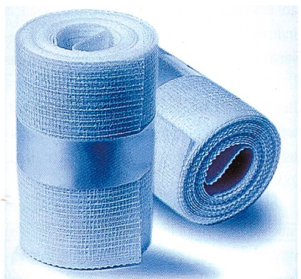
Abb. 4: Thermocast-Bandage mit hochelastischem Trevira Filamentgarn

Permanent schwer entflammare Fasern und Garne sind die Basis für hochwertige Objekttextilien (Trevira CS). Trevira Bioactive Typen erweitern die Funktionspalette und schützen wirksam gegen Mikroorganismen. Trevira Micro Qualitäten, superfein und weich, Trevira Wollmischungen (Trevira Perform), feinfädige und wertig, sind unerlässlich in der Kollektion. Trevira Xpand Qualitäten sorgen für den nötigen Komfort mit Funktion und stehen für eine neue Stretchgeneration. Feinstfädige, kationische Filamente sind wegen ihrer färberischen Vorteile universell einsetzbar.