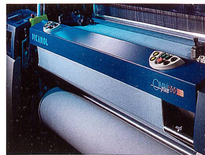
Die neue OMNIplus 800

Alle Maschinenteile sind optimiert für bisher ungekannte industrielle Maschinendrehzahlen, minimalen Unterhalt und maximale Rentabilität. Darüber hinaus ist die OMNIplus 800 randvoll mit Funktionalitäten, die die Realisation von bester Gewebequalität vereinfachen.