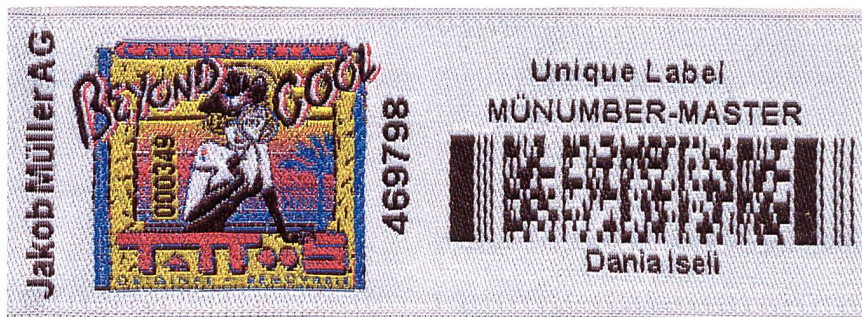
Abb. 1: Fälschungssicheres Etikett mit speziellem Code

Hauptbestandteile sind drei verschiedene Sicherheitssysteme: