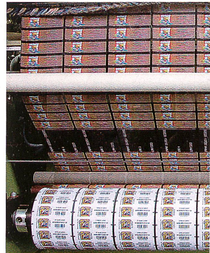
Abb. 3: Etikettenherstellung

Die zufällige Erzeugung der gleichen Zahlenkombination ist also sehr unwahrscheinlich. Andererseits ist es wahrscheinlicher, dass der Fälscher einige Zahlenkombinationen ausliest und diese wiederkehrend auf seinen Etiketten verwendet. Mit dem bisherigen System hat der