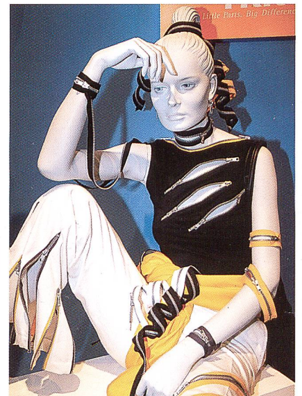
Reissverschlüsse einmal anders – YKK

vierte Befragte zu den Branchen Automobil, Luftfahrt, Polstermöbel, Zelte/Planen/Schwer-textilien, Filtertechnik oder Medizin.