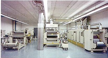
Abb. 2: Das Servicecenter bei der EMS-Chemie

Kontaktwärme aufgeschmolzen. Unabhängig von der Art der Beschichtung erfolgt die Laminatbildung in den meisten Fällen in demselben Arbeitsgang mit einem Zweiwalzen-, Band- oder Flachbandkalander.