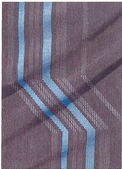
Abb. 8: Power-Net-Produkt mit Elastan 235 dtex und mit 1cm-breiten Elastanstreifen mit der Feinheit von 280 dtex

Grundkonstruktionen umsetzen. Vom dichten Zwei-Maschen-Tüll bis zum transparenten Power-Net ist hier alles möglich. Ein Beispiel zeigt Abb. 8. Das Power-Net-Produkt wurde mit Elastan 235 dtex gefertigt und enthält 1cm-breite Elastanstreifen mit der Feinheit von 280 dtex. Diese Anordnung soll exakt definierte Körperpartien modellieren – das Wäschestück zum Bodybuilder machen – oder aber Muskeln und Gelenke beim Sport stabilisieren. Textiler Support, wenn Höchstleistungen gefragt sind! Extrem hohe Elastizität am richtigen Ort sichert perfekte Passform, verhindert ermüdende Muskel-Oszillation und damit Energievergeudung, steigert die Ausdauer und präzisiert die Bewegung. Diese Möglichkeit zur Platzierung von Powerzonen vermeidet Nähte, die zu Lasten des Komforts gehen und zusätzlichen Konfektionsaufwand bedeuten.