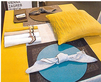
Abb. 3: kitchen & culture