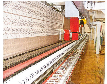
Die integrierte Anlage

Hierbei wird das Lasermuster in der Punchanlage (Stickmustererstellung) wie