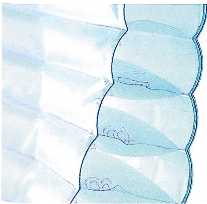
Pneumatischer Flugzeugsitz (Detailaufnahme)

Mit über 10'000 Besuchern, rund 150 Airlines und insgesamt über 400 Ausstellern auf 40'000 m 2 ist die Aircraft Interiors EXPO in Hamburg die grösste Messe der Branche für Flugzeuginterieurs. In diesem Jahr stellte Lantal erstmals das Executive Konzept für Flugzeuginterieurs der Luxusklasse vor: Seien es edel ausgestattete First-Class Oasen, Business Jets oder auch jene fliegenden VIP Paläste, welche die Fantasie beflügeln. Mit einer einmaligen Symphonie aus feinsten Materialien, Teppichen und Ledern für Innenausstattungen eröffnet das Executive Konzept völlig neue Möglichkeiten für eine Welt, in der nur das Beste gut genug ist. Die individuellen Gesamtlösungen beweisen eindrücklich Lantals Kompetenz für kundenspezifische Wünsche.