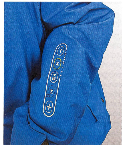
O'Neill – die Steuerung

für das GPSauge. Als führendes Textilinstitut führen die Hohensteiner Institute Forschungs- und Innovationsprojekte im Bereich Wearable Electronics durch. Sie unterstützen Interactive Wear auf dem Gebiet der Qualifizierung von textilen und elektronischen Komponenten. Die Lodenfrey Service GmbH hat sich bereits grosses Know-how im Bereich Fertigung von Bekleidung mit integrierter Elektronik aufgebaut. Der Textilentwicklungs- und Dienstleistungspartner hat den Designent-