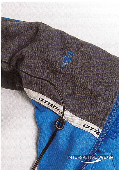
O'Neill – das Mikrofon

Die austriamicrosystems AG steuerte den Multimediachip für die Interactive Wear's P100-Plattform – Kern des MP3-Spielers der GPS-Jacke sowie der Produkte «O'Neill Hub 1» und «Rosner MP3-Blue» – bei. Elektrisola Feindraht, Hersteller von textilem Kabelmaterial, webte spezielle Litzen in textile Bänder zur internen Verkabelung des GPS-Systems (Antenne zu Modul, Stromversorgung, Notrufknopf). Die GPSoverIP GmbH hat das GPSauge nach Vorschlägen von Interactive Wear in Komponenten zerlegt und auf die textile Integration vorbereitet und realisiert das Hosting für das Tracking sowie die Einbindung in verschiedene Kartenprovider bis hin zu Google-Earth. Vom Antennenspezialisten Hirschmann kommen die Antennen