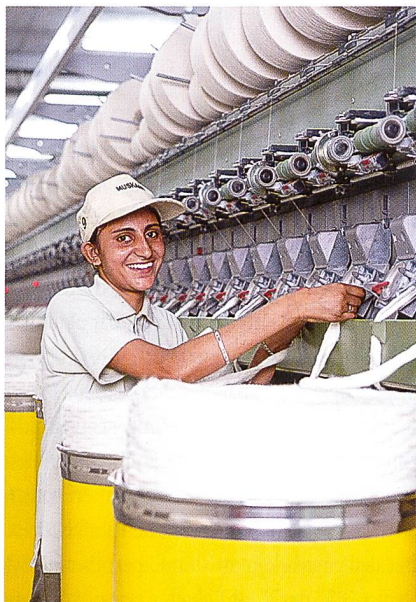
Rotorspinnmaschine R 40

stehen Softwarepakete für die Gestaltung und Auswertung der Effekte als Option zur Verfügung. Diese neue Version der R 40 erschliesst damit einen weiteren Teil des Potentials des Rotorspinnens zum Nutzen der Kunden.