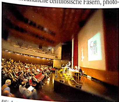
Blick in den Plenarsaal

Traditionell prominent besetzt ist auch die Fachvortragsreihe NEUE ENTWICKLUNGEN BEI FASERN . Der Bogen reicht von nanofaserverstärkten Polyethylenfasern, über PVDF-Garne, Neuentwicklungen bei PET, PTFE-PA Copolymere für Fasern, hitzegenerierende Fasern, Bikomponentengarne, Monofilamente für Komponenten im Fahrzeugbau, regenerierte umweltfreundliche cellulose Fasern, photo-