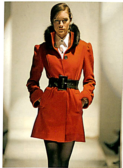
Herbstkollektion von Alice und Olivia

zeigt eine erfrischend innovative Herangehensweise: Bei ihr dominiert schwarzer Woll denim. «Die Entscheidung für Gewebe mit XLA™-Fasern gibt mir die Gestaltungsfreiheit, komfortable und gut sitzende Kleidungsstücke zu entwerfen, die im Laufe der Zeit nicht ausleiern und deren tiefe Farben nicht verblassen», sagt Roi.