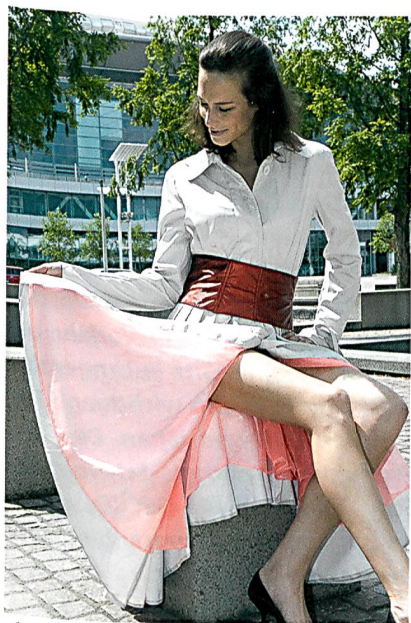
Abb. 3: «c_change» – bionische Klimamembrane – Schoeller Textil AG (CH)

den Marketingmann über den Gotthard- zum Nufenen- und Furkapass. Und plötzlich war sie da, die Eingebung: «Wir bauen Leder nach. Wir machen Gewebe für elastische, wasser- und winddichte Motorradbekleidung, die so gut schützt wie Leder, aber atmungsaktiver, modischer, bequemer und pflegeleichter ist.» Gesagt, getan: Noch im gleichen Jahr liefen die