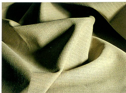
Abb. 1: Brandschutzgewebe

Der Look der abriebfesten und strapazierbaren Entwicklungen für Reisegepäck, Taschen oder Körperschutzbekleidung (Motorrad, Roller) ist clean. Durch den hohen Kevlar®-Anteil halten diese Gewebe viele Belastungen aus. NanoSphere® sorgt dafür, dass Wasser und Schmutz von der Oberfläche abperlen und das Produkt länger schön bleibt.