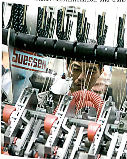
Innovationen auf der ITMA; Foto: Alex Schelbert

«First class facility. Messe München takes good care of all details. Accommodation and trans-