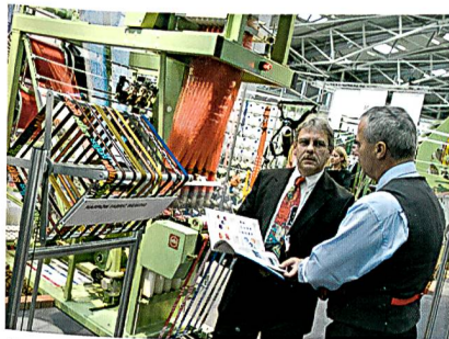
Fachdiskussionen am Stand; Foto: Alex Schelbert