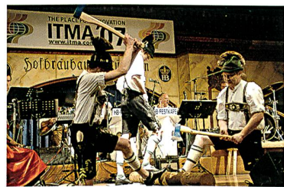
München – die Weltstadt mit Herz. Abendveranstaltung der ITMA 2007

Unser Messeziel ist es, uns auf Innovationen zu konzentrieren. Unsere vier Hauptexp-