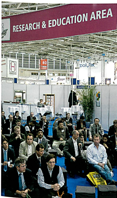
Research & Education Center; Foto: Alex Schelbert