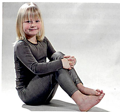
Kleidung ohne Hautreizung

detektiert werden können. Dabei handelt es sich um ein Teilergebnis des AIF Forschungsvorhabens Nr. 14655 N/1 «Untersuchung zur Beseitigung mechanisch ausgelöster Hautirritationen durch textile Gewebe», bei dem u. a. der Grad der Hautrötung gemessen wird, die Textilien auf menschlicher Haut verursachen.