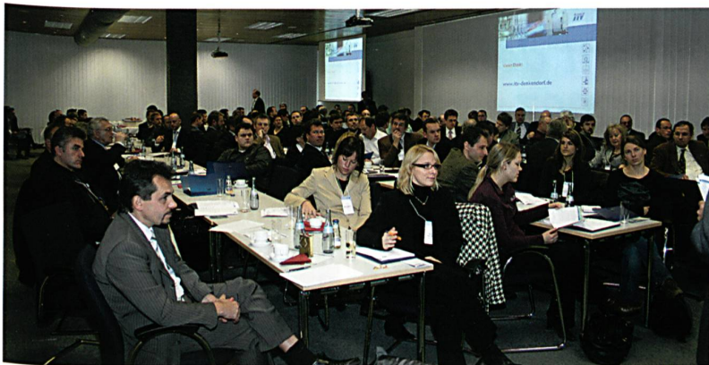
Die Teilnehmer am Nano-Forum

sind eine Vielzahl unterschiedlicher Nanopartikel in textilen Prozessen und Produkten: bioaktive, antimikrobielle, photoaktive, UV-absorbierende, leitfähige und magnetische Partikel, farbgebende Pigmente, Cyclodextrine, Kohlenstoffnanofasern in Verbundwerkstoffen oder nanocompositardarstellende Faserbeschichtungen. Sie alle bieten jeweils abgestimmt auf individuelle Anforderungsprofile die Chance zur weit reichenden Funktionalisierung textiler Werkstoffe. Konkrete Anwendungsbeispiele und Entwicklungen zeigte Stegmaier für die Funktionalitäten Selbstreinigung, elektrische Leitfähigkeit (antistatische Beschichtungen), photokatalytischer Abbau (Abwasseraufbereitung) und Energiegewinnung (lichtselektive low e-Beschichtungen).