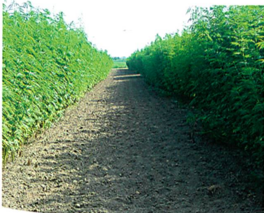
Abb. 2: Hanfanbau in Rumänien 1994

Verbundwerkstoffe für die Automobilindustrie sind von 1'770 auf 2'470 Tonnen (rund 10%) angestiegen, während 824 Tonnen für die Herstellung von Vliesstoffen für Bau- und Isolationszwecke verwendet wurden. Der Markt für Isolationsmaterial verzeichnete wegen ungünstiger Preisunterschiede und technischem Leistungsabfall gegenüber konkurrierender Fasern weniger Wachstum als erwartet. Zunehmend werden auch Formteile (Composites) aus Hanffasern hergestellt (Abb. 3).