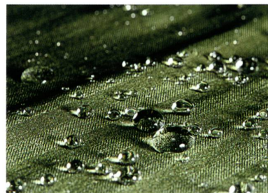
Abb. 1: c_change

Die metallische Glanzbeschichtung auf dem Baumwolle-Voile fühlt sich papieren an, und der Griff der Polyamid-Baumwoll-Mischungen mit geschmirgelten, sandigen Oberflächen fällt eher wachsig oder sogar ölig aus. Von Lacoste inspirierte texturierte Baumwoll-Qualitäten mit 3XDRIY® oder NanoSphere® bieten praktische Wohlühl- und Selbstreinigungsfunktionen. Und man(n) wird bestimmt toll aussehen im Trenchcoat aus dem pastellfarbenen, leicht transparenten Baumwoll-Mikropolyester-Gewebe oder einem ultraleichten Seide-Polyamid-Gemisch mit Microcoating oder mit c_change™-Membrane (Abb. 1).