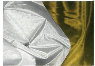
Abb. 2: alu_c_change

Farben oder Materialien. Der schoeller®-shape mit Baumwolle in erdigem, dunklem Naturkolorit auf der Aussenseite leuchtet innen alufarben (Abb. 2). Monofilament-Gewebe im Couture-Stil faszinieren durch einen neuartigen nassen Glanz auf der Front und eine sattere, etwas mattere Farbnuance aus Baumwolle auf der Rückseite.