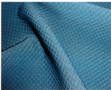
Abb. 3: Hochelastisches Gestrick aus Lykra Power

Dank unvermindert anhaltender Verkaufserfolge bei Eschler haben sich die elastischen Stoffe aus Polyester/Elastan und Polyamid/Elastan zu einem bedeutenden Umsatzträger entwickelt. Daher wurde die e1-Linie um weitere elastische Qualitäten mit Struktur ergänzt, welche dank ihren hervorragenden Dehnungs- und Rücksprungeigenschaften mit dem «Lykra Power»-Label ausgezeichnet werden können (Abb. 3).