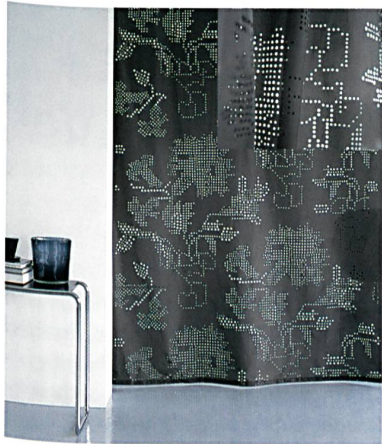
Abb. 2: Bei «Epunto» stellen die Experten von création Baumann ihr Können im Lasercut unter Beweis

das bisherige Sortiment. Die Stoffe verschönern die private Umgebung und verleihen Restaurants, Lounges und Hotels eine persönliche Note. Neben eleganten Unistoffen sorgen zeitlose Jacquard-Dessins in unterschiedlichen Farbwelten für mehr Emotionalität und Funktionalität im Raum. Die Stoffe in schwerentflammbarem, pflegeleichtem Trevira CS lassen sich wie im Baukastensystem nach Belieben zusammenstellen und erlauben zahlreiche Möglichkeiten, einen Raum zu gestalten. Zu den Besonderheiten gehört der markante Vorhang- und Bezugsstoff «Maria». Die Flächen der ineinander geschobenen Kreise sorgen bei dem zweifarbigen Stoff für eine spannende Tiefenwirkung. Neu ist auch «Velos», ein Trevira-CS-Velours mit aussergewöhnlich matter Oberfläche. Ein Bettüberwurf komplettiert die Kollektion: «Calma» bringt durch feine Nadelstreifen und dreidimensionale Rippenoptik Eleganz in den Schlafbereich.