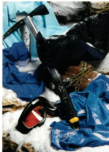
Abb. 2: Impact: Himmel Blau: H-350 - SAE LIM - SCP153P, Blau: H-250 - SITIP - FLASH, Blau: H-250 - FUJIAN K BOXING - N05009, Navy Blau: H-350 - PUCHEON - TCF003

Bei Extrem-Sportlern kommt es auf Bewegungsfreiheit, Komfort und vor allem Schutz an. Die creora Elastan/Spandexfasern ermöglichen die Herstellung leichtgewichtiger und schützender Hochleistungsfasern. Hochmodulare Fasergelege ermöglichen in Verbindung mit creora performance H-350 und creora black H-100D ein lang anhaltendes Schwarz und dunkle Farben (Abb. 2).