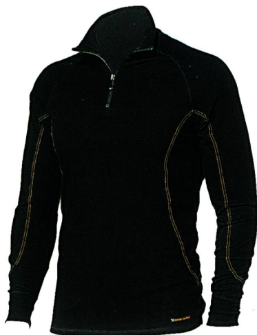
Abb. 1: °Climate Control-Oberteil mit langen Ärmeln und Reissverschluss von Marks & Spencer

Derzeit führt M&S ein langärmeliges Oberteil mit Reissverschluss (Abb. 1), ein kurzär-