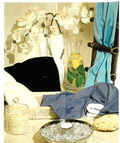
Abb. 3: Comfort Zone: Eine wichtige Komponente ist das energiefreundliche creora eco H-450/C-400

creora eco H-450/C-400. Ökologisch nachhaltige Stoffe entstehen aus Mischungen von creora eco mit nachhaltigen Fasern wie Bambus, Soja, Holz, Milch sowie Zellulose von Modal und Tencel. Eine Methode zum Strukturieren von Jersey bringt Stoffe mit körnigem, unverfälscht natürlichem Touch hervor. Mikro-Struktur-Effekte in Garnen, Mélange-Mischungen und Mélangegefärbte Effektgarne verleihen dem Stoff eine optische Struktur. Diese Entwicklungen sind ideal für Spa- und Yogabekleidung sowie softe Activewear, die in Richtung Homewear geht (Abb. 3).