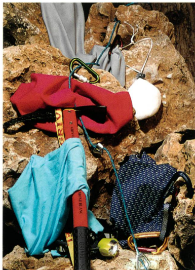
Abb. 1: Intelligent Action: Grau: H-350-PUCHEON-NATWY 250, Rot: KAD149-Hyosung-Aerowarm® 65/72F, Blau: H-250-YISETEX-YSH-1485, Navy Streifen: H-350-ECLAT-R60508082

Die Highlights: creora performance H-350, das in Mischungen mit Polyester und Bambuskohle Verwendung finden kann, und creora