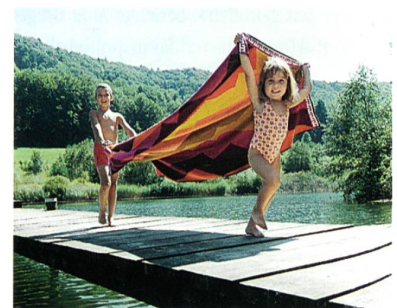
Abb. 1: Nur mit modernsten Webmaschinen ist die wirtschaftliche Herstellung hochwertiger und exklusiver Frottiertgewebe möglich

Das wesentliche Qualitätsmerkmal für Frottiertgewebe ist der Schlingenflor, welcher das Volumen und den Griff mitbestimmt. Ausschlaggebend sind das Schlingenbild, die Gleichmässigkeit der Florhöhe, die exakte Ausbildung von Musterkonturen sowie der Übergang von Glatt- zu Florgewebe und umgekehrt. In diesem Prozess nimmt die Webmaschine eine zentrale Stellung ein. Durch die Kombination modernster Antriebs- und Steuerungstechnik mit raffinierter Frottier-Bindungstechnik wird die Sulzer Textil Greiferwebmaschine G6500F den hohen Ansprüchen an die modische Vielfalt, Qualität und Produktivität vollumfänglich gerecht.