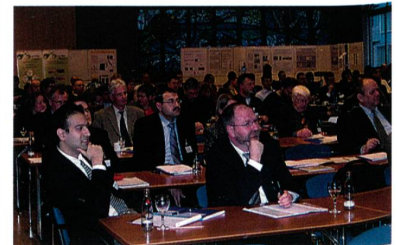
Grosses Interesse auf dem 11. Greizer Symposium EFFEKTE 2008